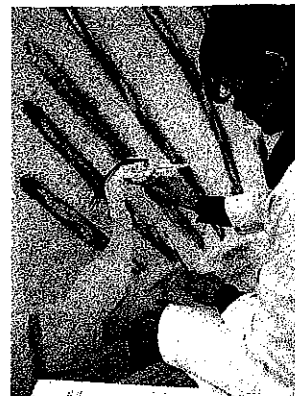
Fresque murale Plage du Coux