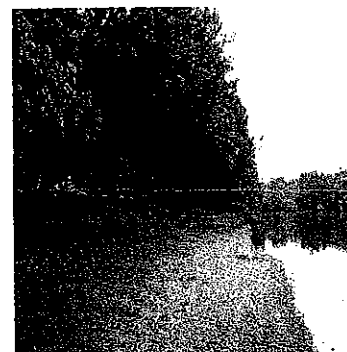
Coupe de sécurisation Plage du Coux