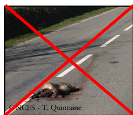
CNCFCS - T. Quintaine

Signaler les blaireaux trouvés sur le bord de la route, mais pas ceux en trop mauvais état