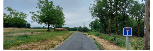
Chemin du Pressillier

Chemin du Pressillier : acquisition et remise en état.